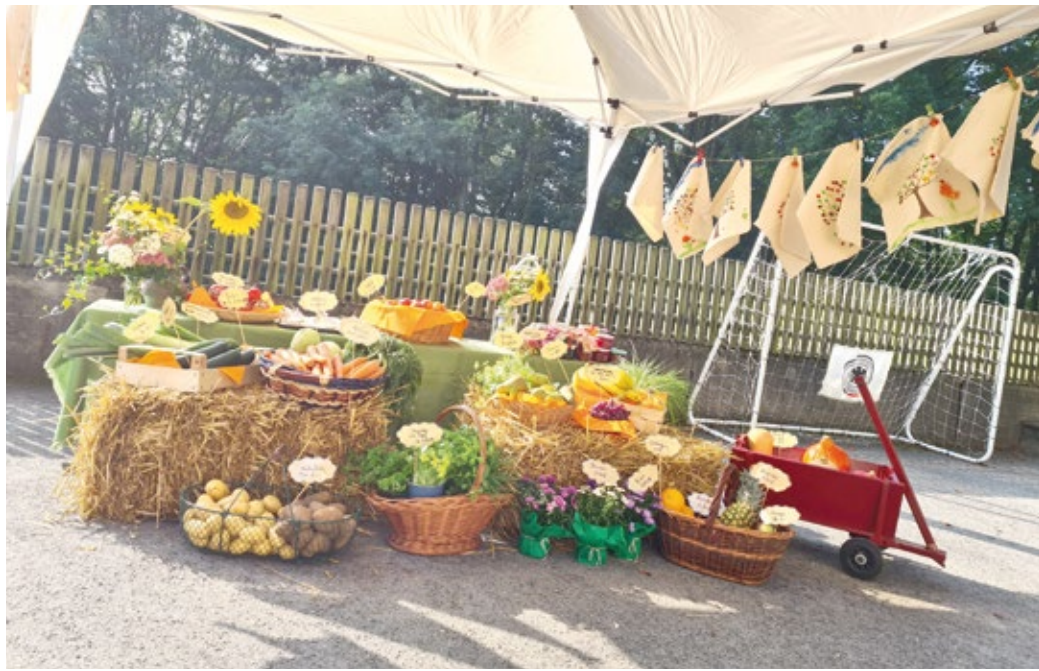
Bei diesem köstlich-bunten Anblick lacht der Herbst.

Herbstfest in der Kita Goldenberg. Nach mehr als 65 Jahren wird die Einrichtung in 2024 geschlossen.