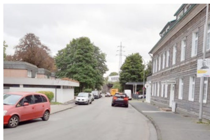
Auch die zum Lennep Bahnhof führende Gartenstraße wird immer wieder zur Rennstrecke.

Das Gremium sprach sich in seiner Sitzung einstimmig für einen gemeinsamen Antrag von SPD, Grüne und FDP aus. Dieser beinhaltet, dass künftig rund um den Bahnhof, schwerpunktmäßig in den Abend- und Nachtstunden, Geschwindigkeitsüberwachungen durchgeführt werden. Bisher sind diese nur tagsüber erfolgt, obwohl bekannt ist, dass das Problem eher in den späteren Stunden