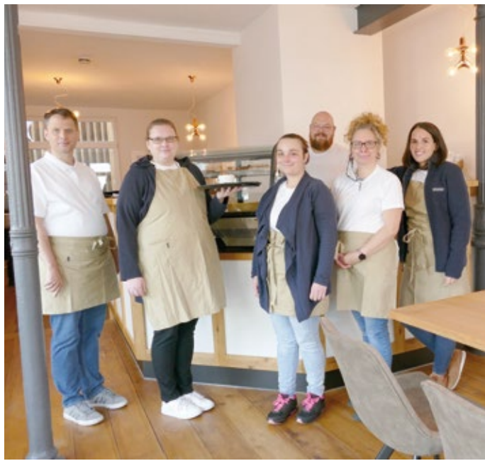
Das freundliche Team des „Café achtsam“ verwöhnt die Gäste in der Lenneper Altstadt mit Kaffee, Kuchen und mehr.

Das Café achtsam in Lennep hat die ersten Gäste begrüßt.