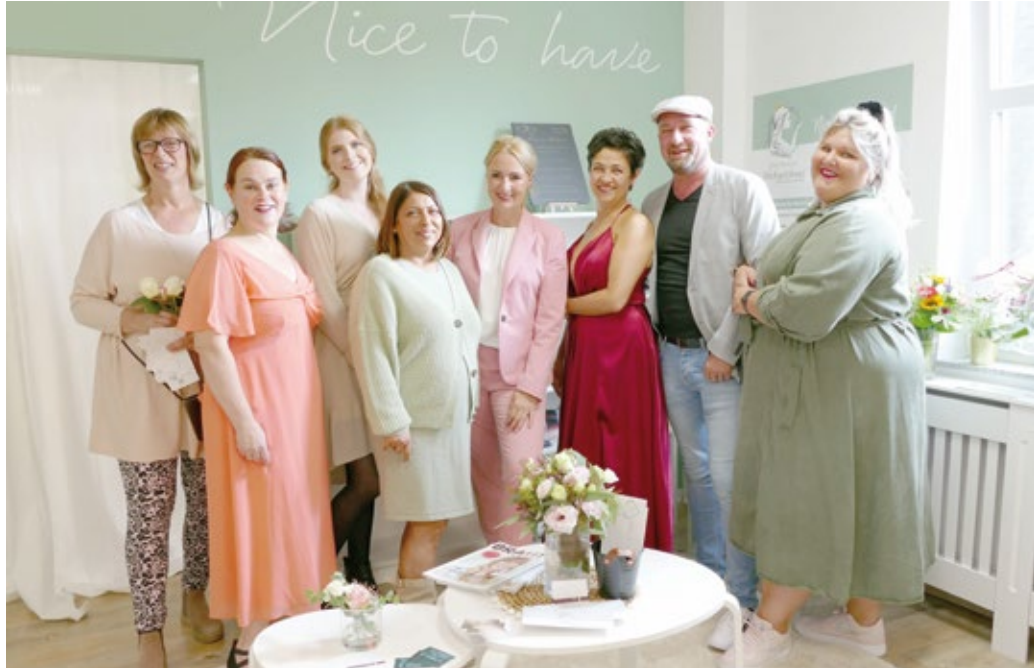
Die Hochzeits-Dienstleister sind startklar, um vielen Brautpaaren den Traum vom schönsten Tag im Leben zu verwirklichen.