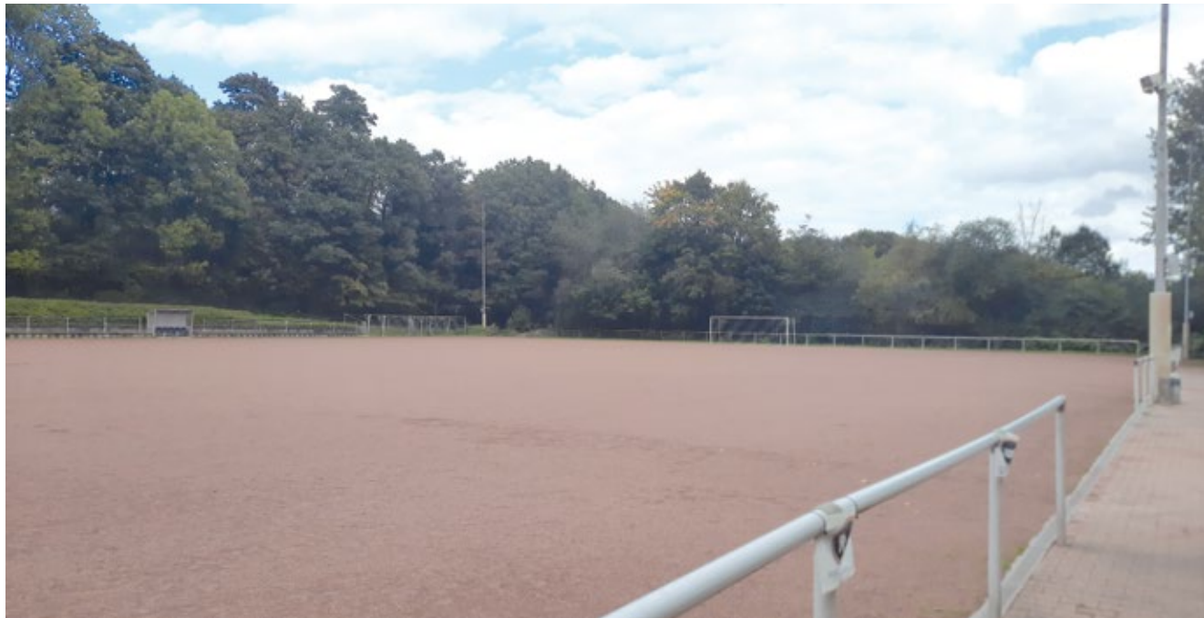
Aschenplätze wie der des FC Klausen sind schon lange nicht mehr en vogue. Die Vereine befürchten massiven Mitgliederschwind, wenn der Wunsch nach Kunstrasenplätzen nicht umgesetzt wird.

Sowohl der FC Klausen in Lüttringhausen als auch die SG Hackenberg in Lennep wünschen sich dringend eine Aufwertung ihrer Sportanlagen. Heute befasst sich der Hauptausschuss mit dem Thema