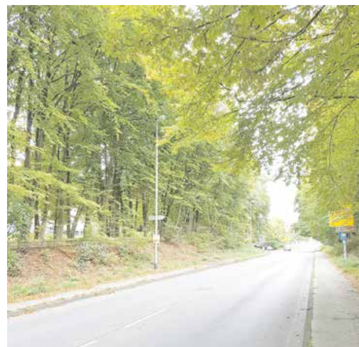
Auf diesem Teilstück der Ringstraße sollen 28 Laubbäume gefällt werden.

ungsplan stehen, der sich derzeit aufgrund der Klagen auf dem Prüfstand der Gerichte befinden, sei ungewiss, ob und in welcher Form die Planung überhaupt umgesetzt werden könnten. Damit sei auch völlig ungeklärt, ob eine Aufweitung der Ringstraße erforderlich sein werde. Schädlich sei die Maßnahme nicht nur aus finanziellen Gründen, sondern auch aus ökologischer Sicht und aus Gründen der Glaubwürdigkeit. Die Bürgerinitiative hält die Fällungen für „völlig unangebracht und schädlich für die Bürgerinnen und Bürger der Stadt Remscheid“. Daher solle die Beschlussvorlage zurückgezogen bzw. zurückgewiesen werden.