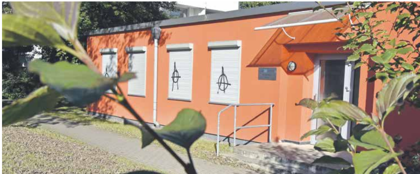
Seit drei Jahren sind die Türen des Seniorentreffs geschlossen. Dies soll sich alsbald ändern.

Die ältere Generation soll wieder einen Anlaufpunkt in Klausen haben. Dazu wurde jetzt die LEG mit ins Boot geholt.