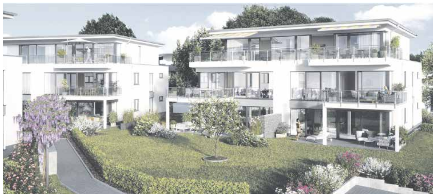
Drei exklusive Häuser mit Tiefgarage und je vier Eigentumswohnungen und einem traumhaften Penthouse entstehen zurzeit am Rädchen.

Modernes Wohnen – naturnah leben in exklusiven Eigentumswohnungen.