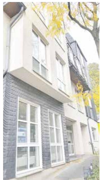
Die Idee, in der Gewerbeimmobilie die Bücherei anzusiedeln, wird konkreter.

Viele Entwicklungen in Lüttringhausen wurden in der Stadtteilkonferenz zum Thema gemacht.