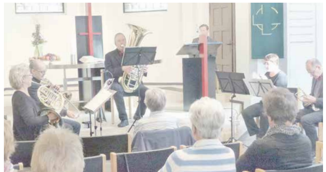
Viele Besucher genossen den Auftritt in der Kirche Tannenhof.

Das Remscheider Blechbläserquintett besteht aus Musiklehrern und versierten Amateuren, die alle als Solobläser in verschiedenen Orchestern in Wuppertal, Burscheid und Düsseldorf spielen.