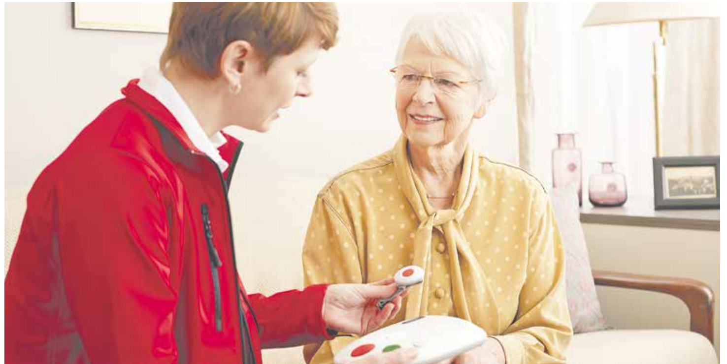
Der Hausnotruf-Knopf wird diskret am Hals oder am Handgelenk getragen.

Johanniter geben Tipps zur Wohnraumanpassung für Senioren.