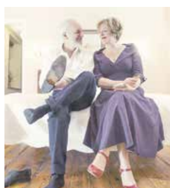
Wenn die Kompressionsstrümpfe gut sitzen, steht einem Abend voller Lebensfreude nichts mehr im Wege.

naus benötigt man dazu Kraft. Fehlt diese, können Anziehhilfen den Mangel ausgleichen. Wie beispielsweise die An- und Ausziehhilfe „Ofa Fit Magnide“. Diese wird zuerst wie ein Strumpf über den Fuß gezogen. Der Kompressionsstrumpf gleitet anschließend über das glatte Material und kann wesentlich leichter über die Ferse gezogen werden. Beschichtete Spezialhandschuhe sind eine zusätzliche Erleichterung, mit ihnen lassen sich die Strümpfe leichter greifen und schrittweise nach oben streifen.