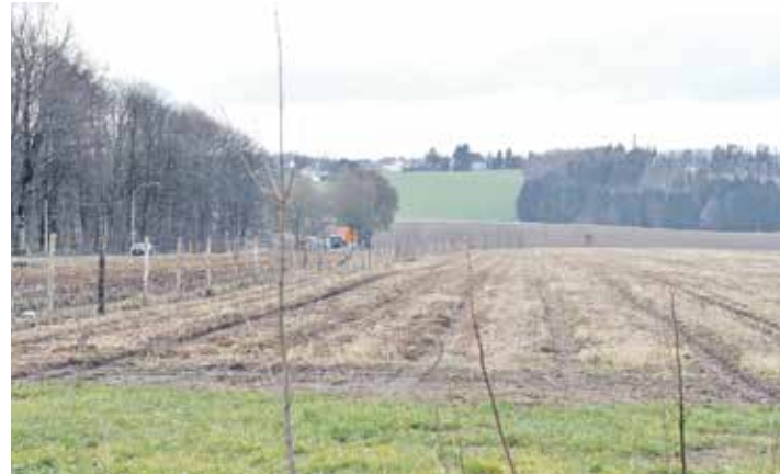
Auf den so genannten Erdbeerfeldern an der Borner Straße soll Gewerbe entstehen.