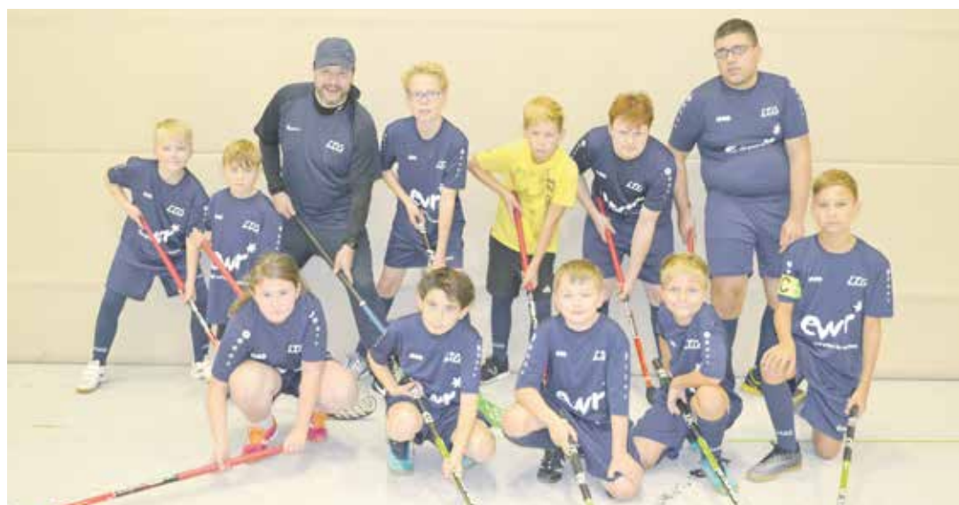
Erstmals gab's gesponserte Trikots für die Floorballer der LTG.

„Wir verbinden Sport und Spaß. Die Grundtechniken sind leicht zu erlernen, so dass sich schnell Erfolgsergebnisse einstellen“, erklärt er. Die Spieler laufen rasant hinter dem kleinen Lochball hinterher, um ihn ins Tor zu schlagen. Nach nur