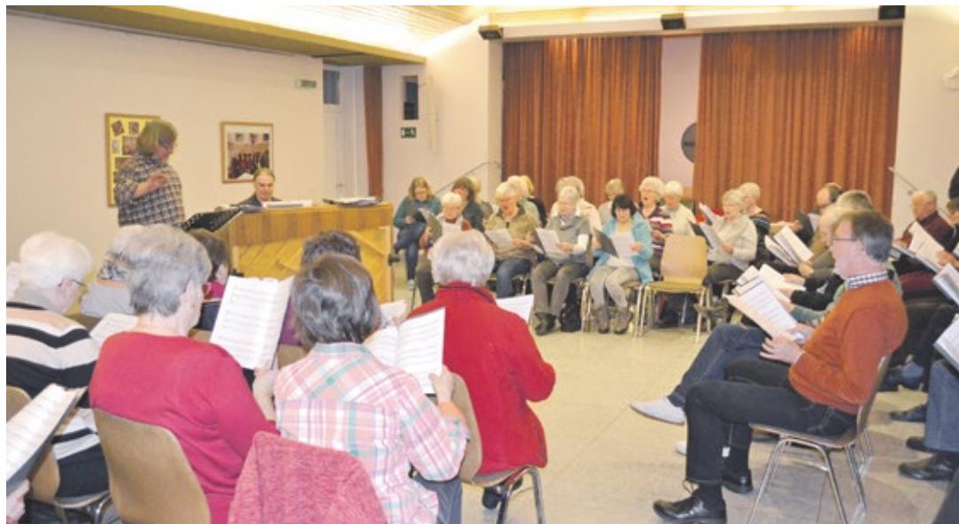
Die künftigen Musicalsänger bei der ersten gemeinsamen Chorprobe.

Die Katholische Kirche St. Bonaventura feiert mit einem Musik-Projekt ihr 150-jähriges Jubiläum.