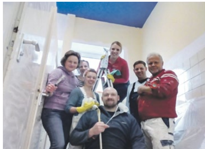
Wer will fleißige Handwerker sehen?

Durch die großartige Unterstützung von verschiedenen Sponsoren und die Arbeitsleistung der Eltern können die Toiletten schon vor der geplanten Komplettrenovierung in zwei Jahren ein bisschen ansprechender gestaltet werden. „Bevor wir streichen konnten, haben wir erst mal drei Stunden lang geputzt.