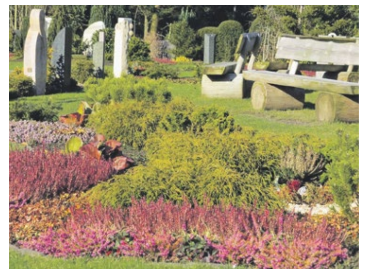
Mittlerweile gibt es 80 „Memoriam-Gärten“ deutschlandweit - die wunderschön gestalteten Gärten sind zugleich Teil eines Friedhofs.

und Rückzugsmöglichkeiten für Tiere machen die Begräbnisstätte zu einem besonderen Ort der Erinnerung. Alle gärtnerbetreuten Grabanlagen sind wie kleine Gärten gestaltet, wobei Gräber und Rahmenbepflanzung eine harmonische Einheit bilden. Jeder Verstorbene wird auf den Grabmalen mit Namen und Lebensdaten genannt. Bereits zu Lebzeiten kann mit dem Friedhofsgärtner ein Dauergrabpflegevertrag dafür abgeschlossen werden. Eine Dauergrabpflegeorganisation der Friedhofsgärtner überprüft die Einhaltung der Verträge und verwaltet die eingezahlten Gelder. Mehr Informationen gibt es unter www.naturruh.de, www.ruhegemeinschaften.de oder www.memoriam-garten.de.