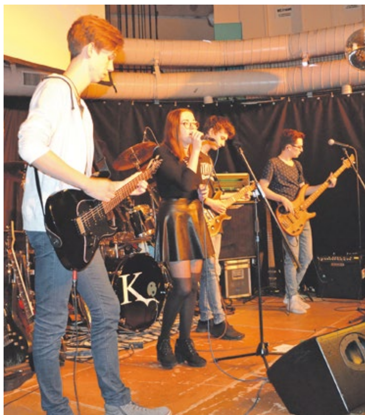
Die Schülerband Apex rockte das Haus.

Durch das Benefizkonzert kamen über 700 Euro zusammen.