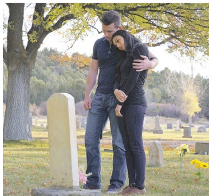
Der Tod hinterlässt Lücken.

Angesichts der kurzen Zeit, der Kosten und der seelischen Verfassung der Familienmitglieder können die Wünsche des Toten oftmals nicht ausreichend berücksichtigt werden. Eine selbst verfasste Bestattungsverfügung kann diese Situation erleichtern: Hier erklärt man, wer sich um die Bestattung kümmern, an welchem Ort die Beisetzung stattfinden oder wie die Grabgestaltung aussehen sollte. Die aufgewühlten Hinterbliebenen