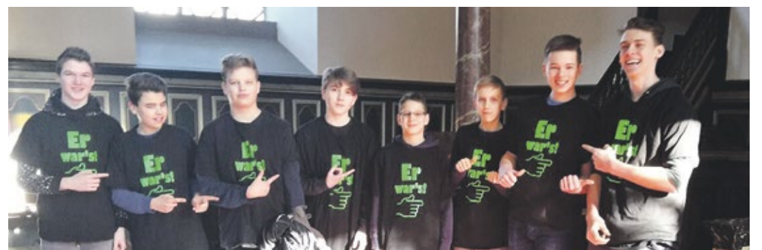
Die Konfirmanden mit den „Er war's“-Shirts in der Lütterkuser Kirche.

Schuld sind immer nur die anderen. Oder nicht...?