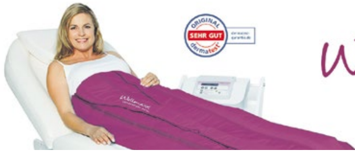
Effektive Massagemethode durch innovatives Gerät bei Wohlfühl Momente.

Der Wunsch nach weniger Oberschenkelumfang, der Reduzierung von Cellulite-Erscheinungen oder auch nach strafferer Haut kann erfüllt werden. Irene Mokstadt verbindet angenehme Massage mit einem echten Wellness-Erlebnis. Ohne Sport. Ohne Stress. Aber mit Wohlfühl-Garantie.