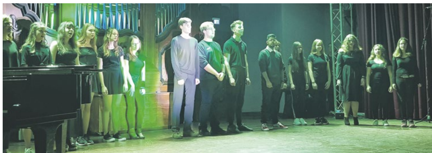
Konzert im Röntgen-Gymnasium: Gegen Hass, gegen Ausgrenzung, gegen Mobbing.

Oberstufenkonzert im Röntgen-Gymnasium sorgte für Gänsehaut-Momente.