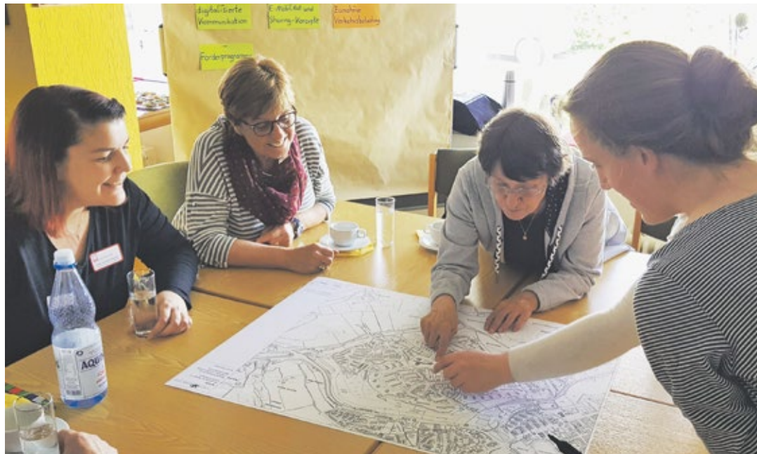
Bei der Zukunftswerkstatt wurden viele Ideen für den Hasenberg erarbeitet.

Eine Zukunftswerkstatt mit Unterstützung der Stadt tagte im Begegnungs- und Beratungszentrum (BBZ) Hasenberg.