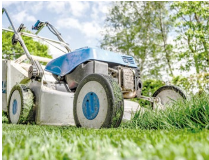
Wer mindestens einen Monat im Frühling und / oder Sommer lang nicht mäht, kann bereits einige ökologische Verbesserungen im eigenen Garten beobachten.

(red) In vielen Gärten wird der Rasen im Frühling, Sommer und Herbst mindestens zweimal im Monat, oft aber auch häufiger gemäht. Ergebnis ist ein „im besten Falle“ fast ausschließlich aus Gräsern bestehender, kurzgeschorener Rasen. Rasenflächen machen nicht selten mehr als die Hälfte der Gesamt-Gartenfläche eines Hauses aus und sind oft selbst im Kleingarten relativ groß.