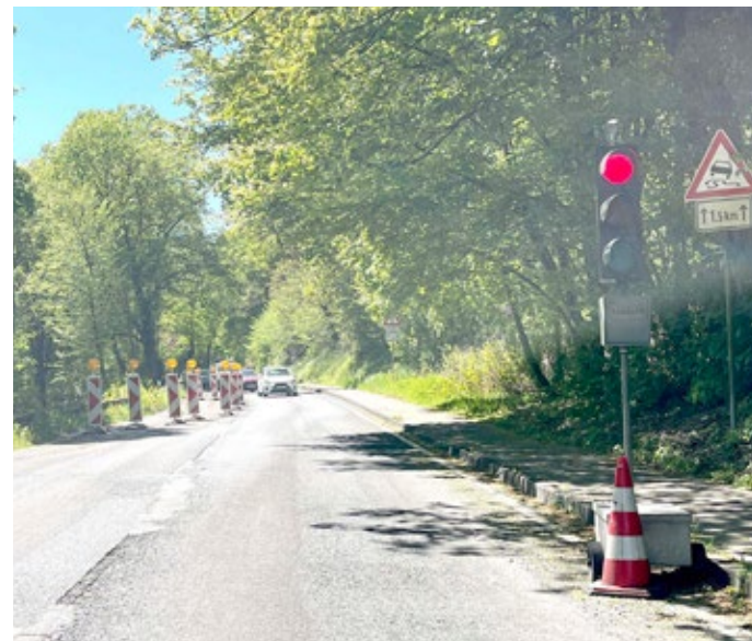
Die Baustellenampel an der Ronsdorfer Straße zwischen Birdgen und Halbach – seit Mai 2025 regelt sie den Verkehr an der abgesackten Fahrbahn. In den Sommerferien 2026 sollen die Sanierungsarbeiten endlich beginnen.