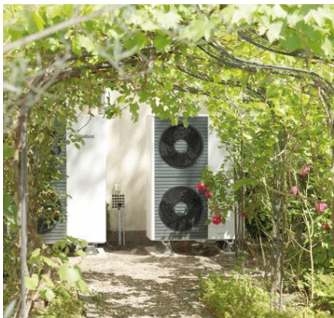
Wer heute in Wärmepumpe investiert, trifft eine Entscheidung für die nächsten 20 bis 30 Jahre.

(txn) Die geplante Reform des Gebäudeenergiegesetzes sorgt erneut für Diskussionen. Die Union möchte die Vorgabe streichen, dass neue Heizungen künftig zu mindestens 65 Prozent mit erneuerbaren Energien betrieben werden müssen. Doch der Vorstoß könnte juristische Folgen haben. „Wenn Deutschland die europäischen Klimavorgaben unterläuft, wird Brüssel reagieren müssen“, warnt Energieexperte Andreas Zehmisch von DUSW. Im schlimmsten Fall drohe ein Vertragsverletzungsverfahren. Branchenvertreter sprechen sogar von möglichen Strafzahlungen in Milliardenhöhe, die auf den deutschen Steuerzahler zukommen könnten.