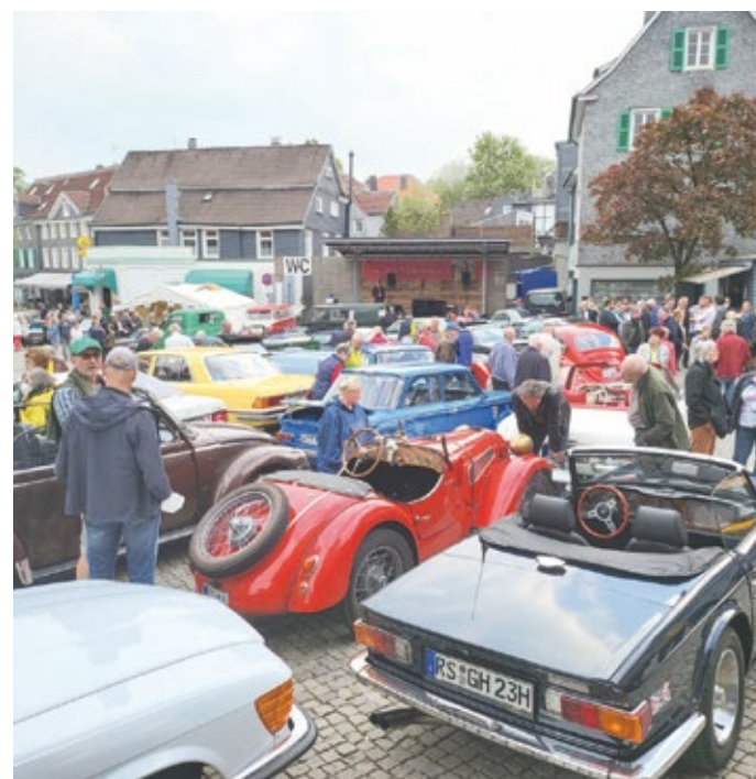
Einstimmender Abend in der Lenneper Altstadt.

verfolgen ein klares Ziel: Das Feld der teilnehmenden Fahrzeuge soll möglichst bunt und abwechslungsreich sein. Bei annähernd einhundert Veteranen möchte man nicht zwanzig gleiche Mercedes oder Porsche im Starterfeld sehen – selbst wenn diese unterschiedliche Farben hätten. Die Zuschauer an der Strecke und den Zuschauerpunkten sollen ein vielfältiges Bild erleben: verschiedene Automarken, Baujahre und Karosserieformen, von der eleganten Limousine über sportliche Cabriolets bis hin zu klassischen Coupés.