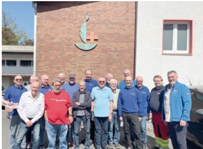
Die Fahrer des Remscheider Bürgerbusses haben einen Erste-Hilfe-Kurs beim Roten Kreuz absolviert – sieben Stunden Theorie und Praxis, von der stabilen Seitenlage bis zur Herzdruckmassage.

(red) Sieben Stunden lang tauschten die Fahrer des Remscheider Bürgerbusvereins das Lenkrad gegen die Schulbank und wurden dabei ordentlich gefordert. In einem Ersthelferkurs beim Roten Kreuz lernten die Ehrenamtlichen, wie sie im Notfall richtig reagieren. Die Idee kam nicht von ungefähr: Viele Fahrgäste des Bürgerbusses sind älter. Einem medizinischen Notfall gab es zwar noch nie, doch der Verein wollte für alle Fälle gewappnet sein. Ausbilder Hermann Mischel machte es seinen „Schülern“ nicht leicht. Jeder musste ran – Kollegen in die stabile Seitenlage bringen, am Übungsmodell die Herzdruckmassage trai-