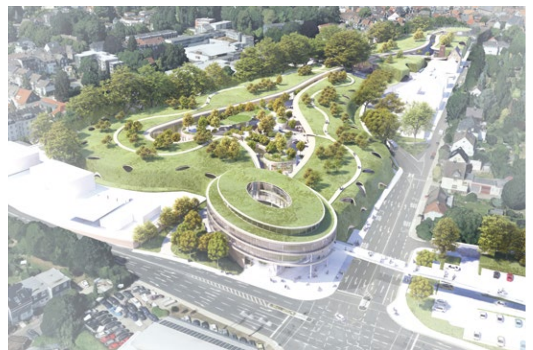
Die Vogelperspektive zeigt, wie das Outlet nach den Plänen des Investors aussehen könnte.