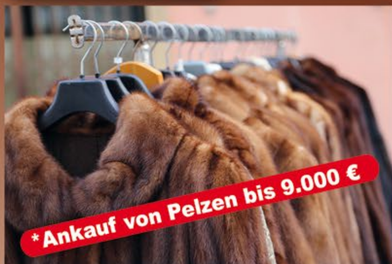
*Ankauf von Pelzen bis 9.000 €

Wir kommen auch zu Ihnen! (im Umkreis von 30km)