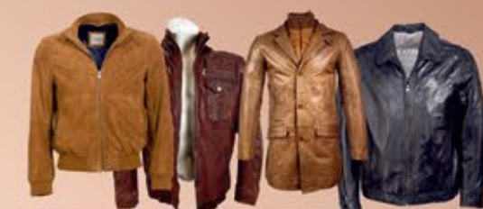
Ankauf von Leder- jacken & Ledermäntel bis 2.500,-€