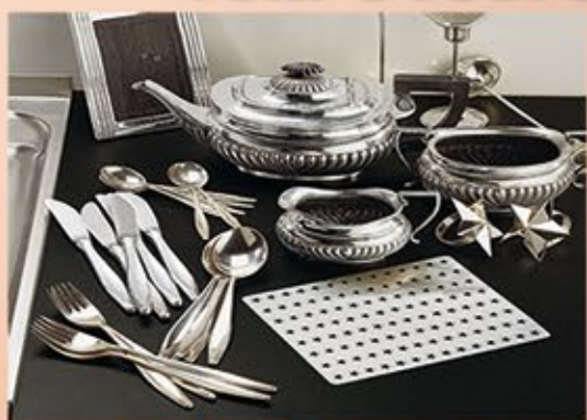
Ankauf von Silberbesteck