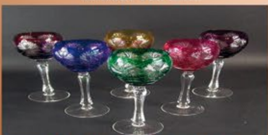
Ankauf von Römergläser