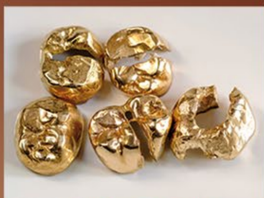
Ankauf von Zahngold

Große Silberankaufaktion wir zahlen bis zu 1,-€ für jeden Gramm Silber