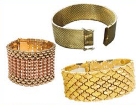
Ankauf von Goldarmbänder

Wir kommen auch zu Ihnen! (im Umkreis von 30km)