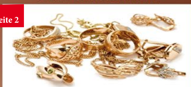
Goldringe & Ketten aller Art