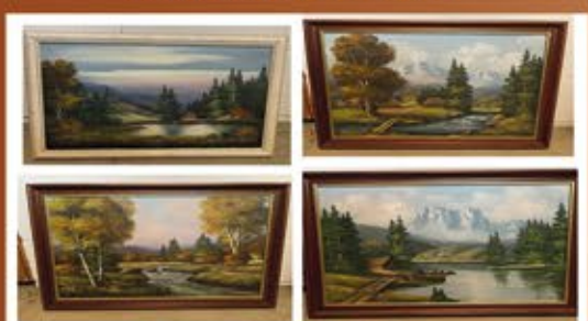
Ankauf von Bildern