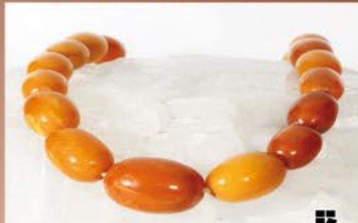
Ankauf von Bernstein