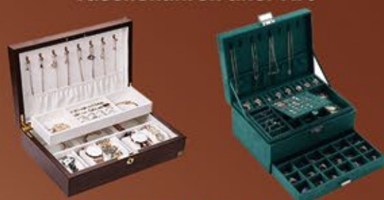
Ankauf von Modeschmuck