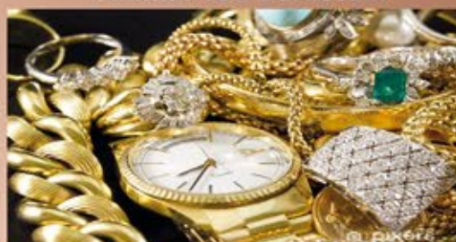
Ankauf von Modeschmuck aller Art