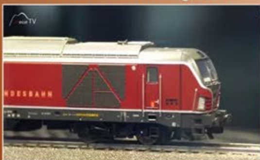
Ankauf von Merklin