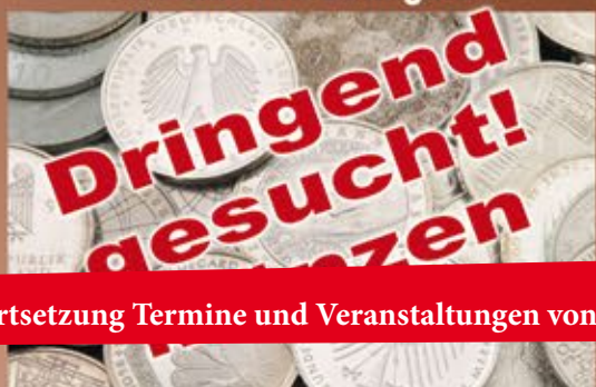
Ankauf von Münzen aller Art