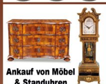
Ankauf von Möbel & Standuhren