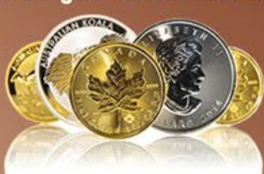
Ankauf von Gold- & Silbermünzen aller Art