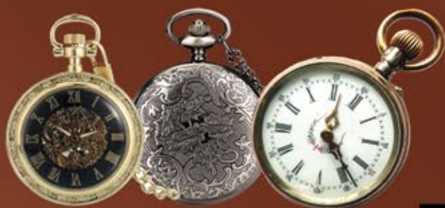
Taschenuhren aller Art