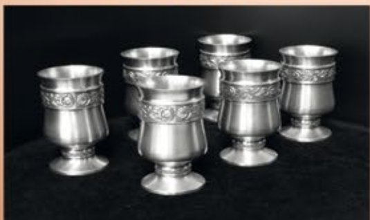
Ankauf von Zinn