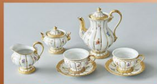
Ankauf von Geschirr

Wir kaufen an: Wir zahlen bis zu 120,-€ pro Gramm für feingold