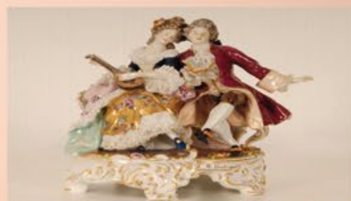
Ankauf von Meissener Porzellan

Wir kaufen an: Wir zahlen bis zu 120,-€ pro Gramm für feingold