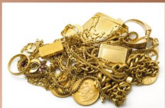
Ankauf von Goldschmuck