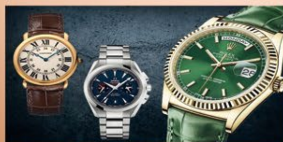
Ankauf von Markenuhren aller Art