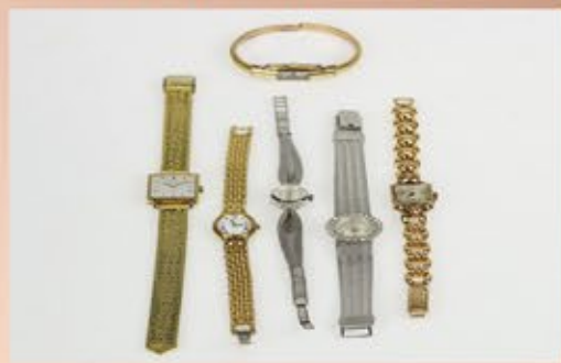
Ankauf von Damenuhren aller Art