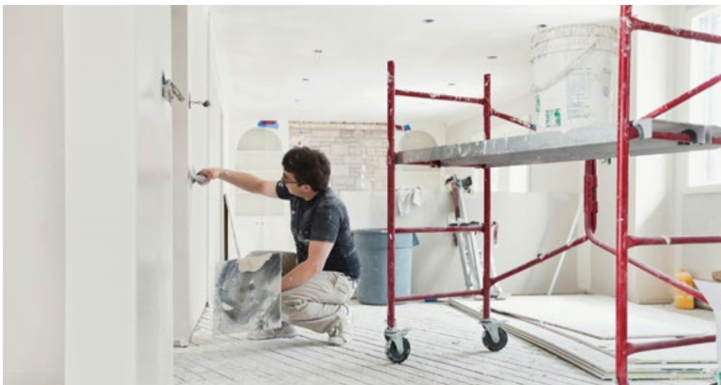
Bei Modernisierung und Sanierung sollte man den Versicherungsschutz an die baulichen Veränderungen anpassen.

Auch wenn die Umbauten abgeschlossen sind, sollte