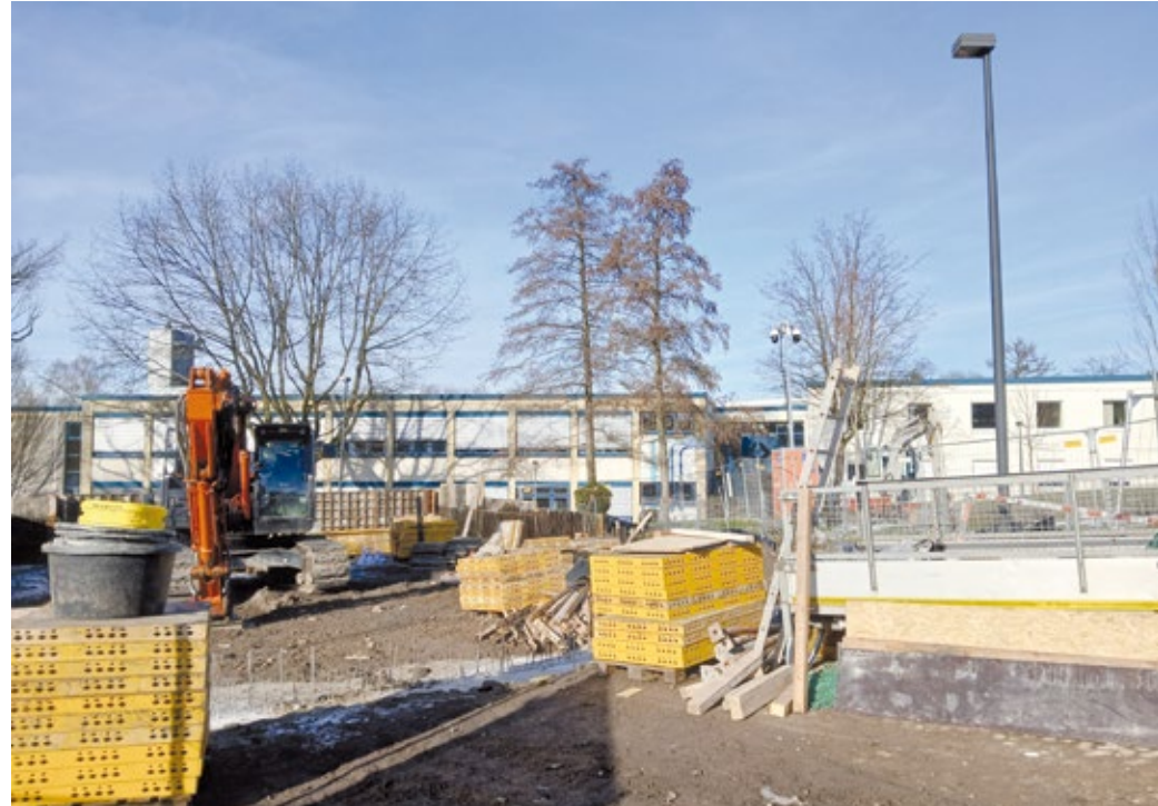
Derzeit laufen die Vorbereitungen auf dem Lehrerparkplatz des Leibniz-Gymnasiums, wo Modulbauten für den Übergang installiert werden. Dort wird während der Bauphase unterrichtet.

Um den räumlichen Anforderungen gerecht zu werden, die durch eine Rückkehr von G8 zu G9 an den Gymnasien aktuell werden – also neun Jahrgänge bis zum Abitur +r statt der bisherigen acht – müssen Remscheider Schulen erweitert werden. So bekommen alle vier Remscheider Gymnasien Anbauten für die benötigten Klassenräume des zusätzlichen Jahrgangs. In Lennep werden dafür zwei Pavillons abgerissen. Entstehen soll ein komplett neuer Riegel mit insgesamt zwölf neuen Klassenräumen. Bevor Abriss und Neubau begonnen werden können, müssen durch