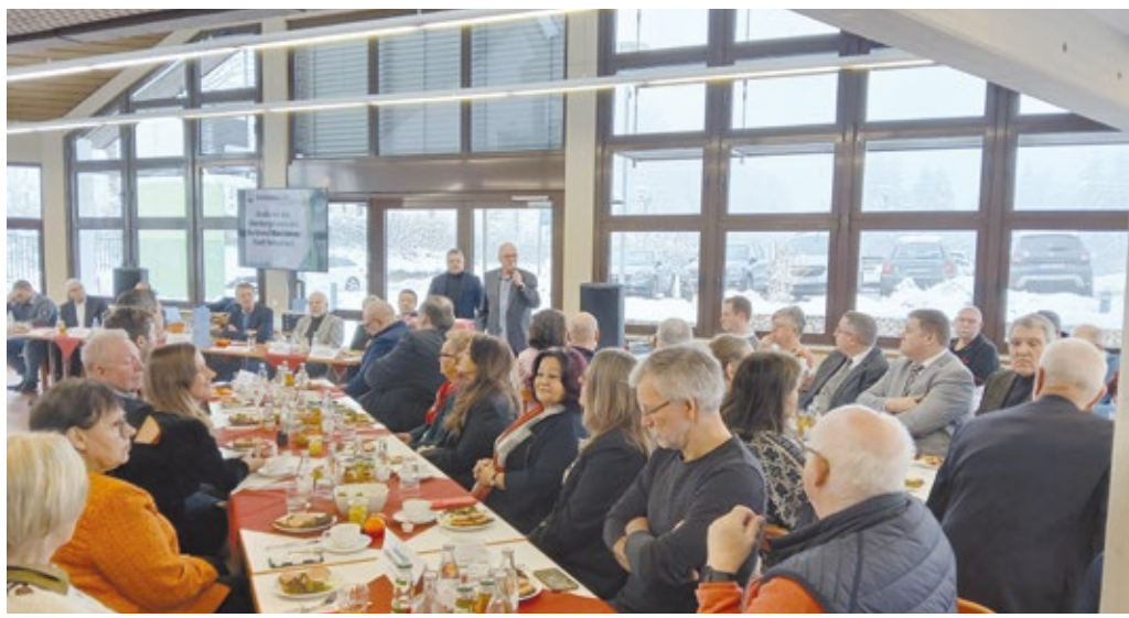
Volles Haus: Landet die Einladung des Heimatbunds zum traditionellen Neujahrsempfang im E-Mail-Postfach, sagt kaum jemand „Nein“.

Das Kottenbutter-Essen des Heimatbunds Lüttringhausen hob viele Themen aufs Tapet.