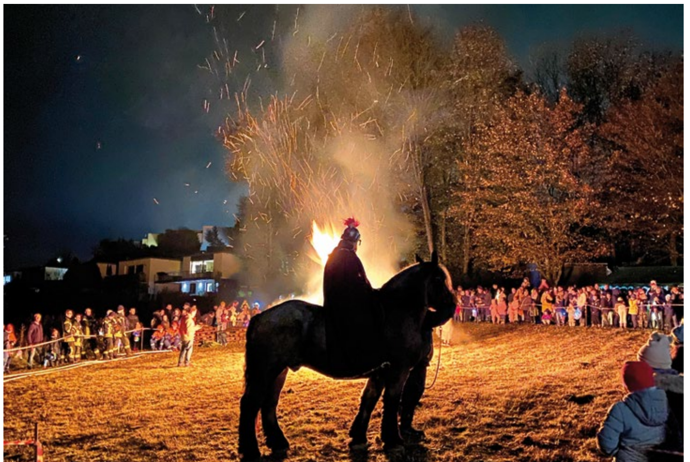
Die Ehrenamtler in Lennep und Lüttringhausen wollen auch in diesem Jahr für die Kinder wieder stimmungsvolle Martinsumzüge organisieren – wie im letzten Jahr auf dem Hasenberg.