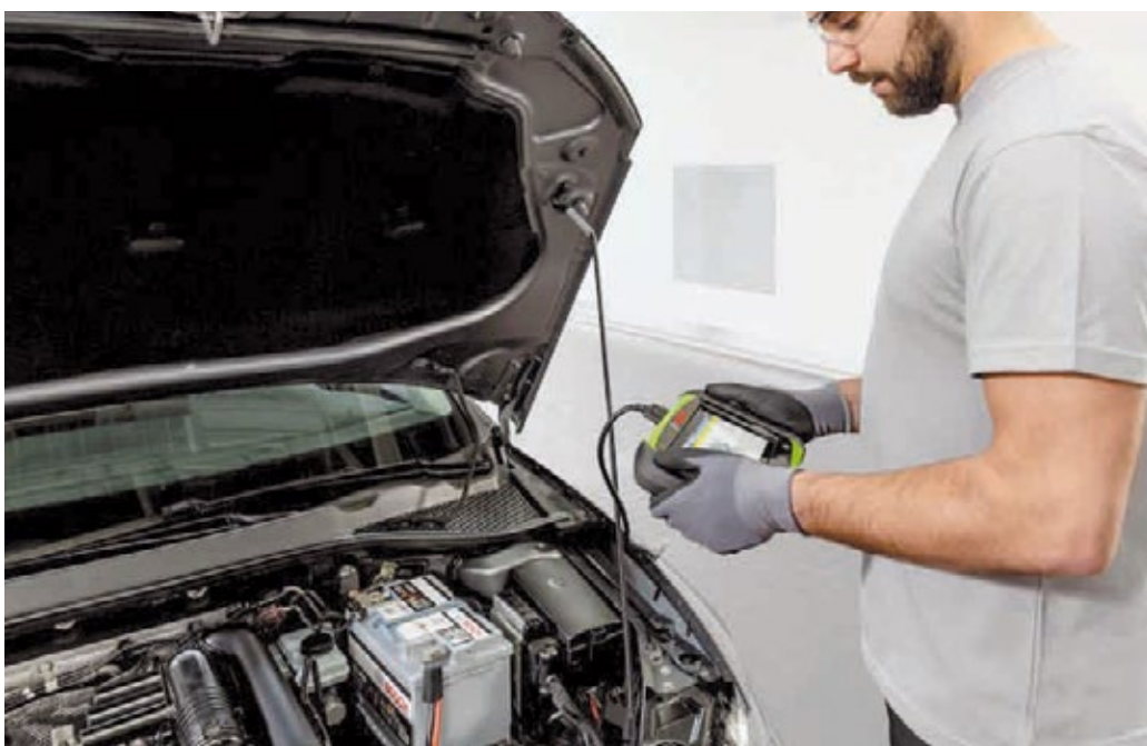
Ein Check der Autobatterie schützt vor ärgerlichen Pannen. Werden in der Werkstatt Schwächen festgestellt, kann der Energiespender direkt ausgetauscht werden.

Mit einem Batterie- und Wintercheck möglichen Autopannen vorbeugen.