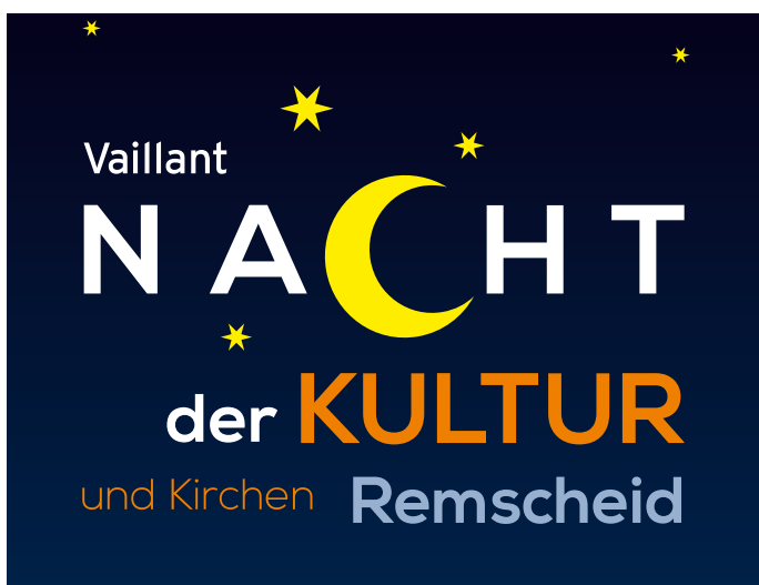
Am Vorabend des Röntgenlaufs kommen erneut die Kulturhopper auf ihre Kosten.

(red) Das letzte Oktoberwochenende steht in Remscheid erneut im Zeichen von Kultur und Sport. Los geht's am Samstag, 26. Oktober, mit der „Vaillant Nacht der Kultur und Kirchen“, die traditionell am Vortag des Röntgenlaufs stattfindet. Wieder setzt die Stadt dabei auf die bewährte Zusammenarbeit mit den Vereinen, Institutionen und auch privaten Veranstaltern. Musik, Theater, Gestaltung, Lesungen oder Film – viele Kulturschaffende präsentieren an teils ungewöhnlichen Orten, an denen man sie nicht unbedingt erwarten würde, ihr Können und nehmen ihre Gäste mit auf den