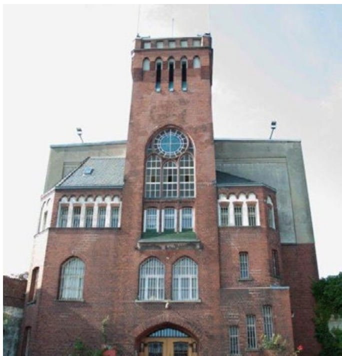
Der historische Kern der JVA in Lüttringhausen ist rund 120 Jahre alt.

650 Haftplätze insgesamt Das bedeutet, dass die Haftanstalt bis zum Baubeginn komplett leer gezogen sein muss und diese Gefangenen sukzessive auf andere JVA